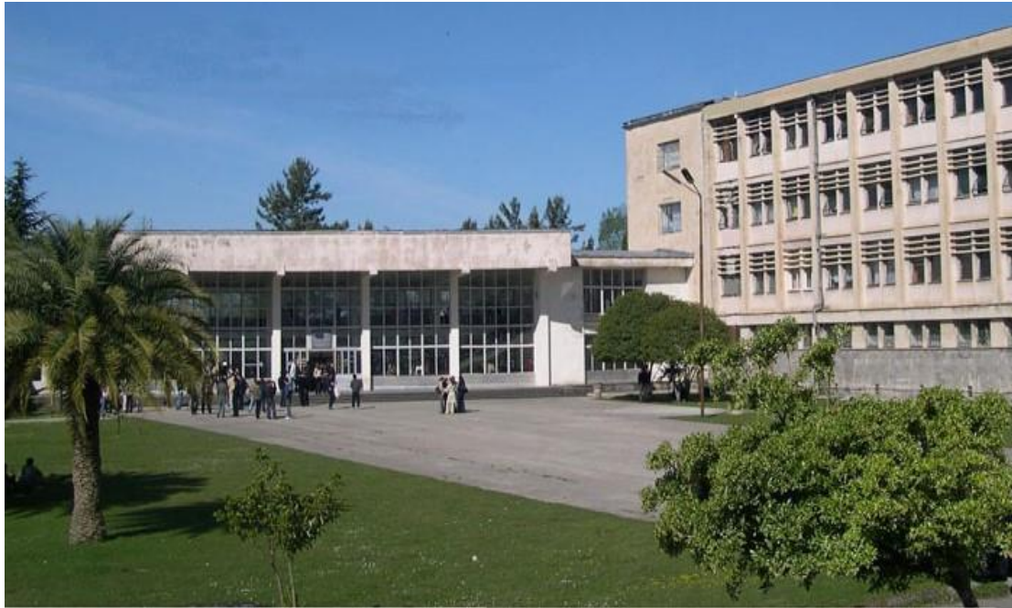
Сухумский Открытый Институт